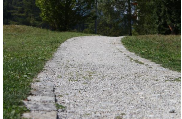
Wir finden unseren eigenen Weg durch Selbstwahrnehmung, Vertrauen und Verständnis.