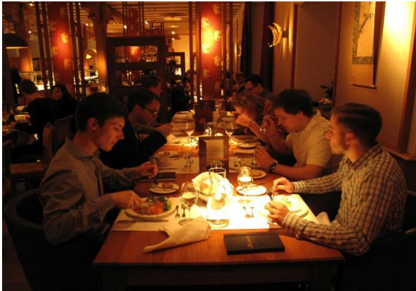
Die Tage endeten mit dem gemeinsamen Abendessen, bei welchem wir den Tag Revue passieren ließen und das enstpannte Miteinander genossen.