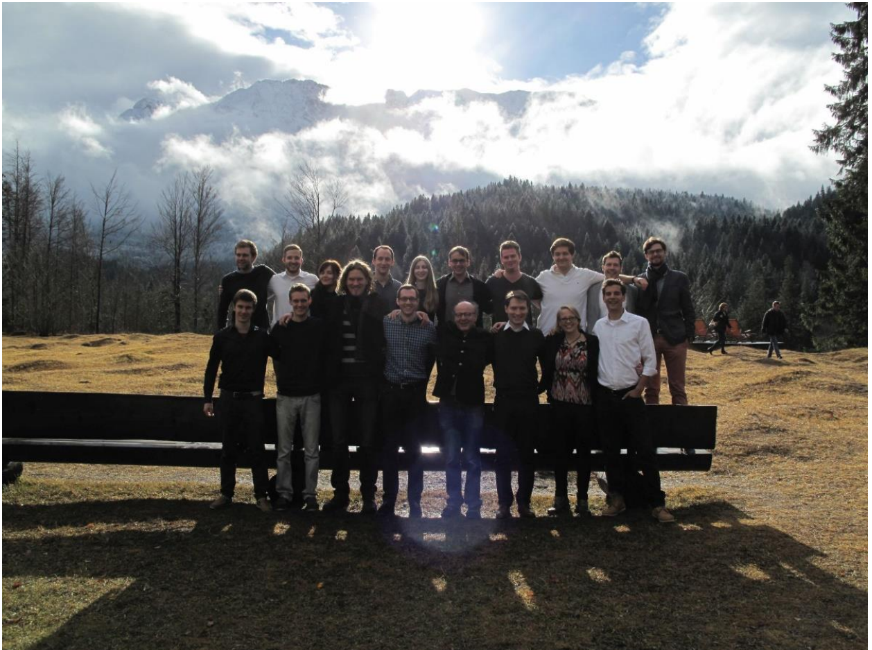
Unsere Selbstfindung und Suche nach Antworten wurden am letzten Tag der Akademie von der uns umgebenden Natur widergespiegelt: So lichtete sich am letzten Tag der Nebel um das Wettersteingebirge herum, der Wind vertrieb die Wolken, der Schnee bedeckte Gipfel erstrahlte in der Mittagssonne und ließ dieses Gruppenbild entstehen. Diese Woche prägte uns alle zutiefst. Wir haben es als unglaubliches Privileg empfunden, diese Erfahrungen machen zu dürfen, und können allen Beteiligten nicht genug danken. Von Herzen: Danke!